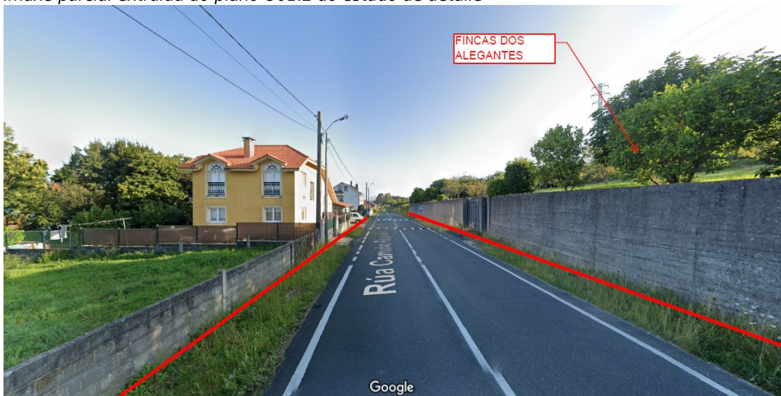
Vista extraída do Google Maps correspondente á zona obxecto das alegacións